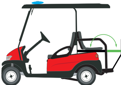
Module arrière FLIP-FLAP, banquette rabattable