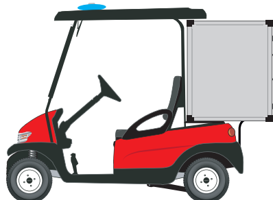
Module arrière CAISSON en ALUMINIUM