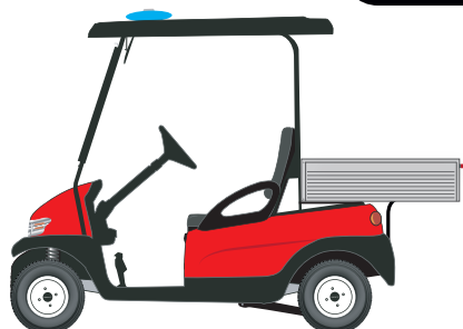
Module arrière BENNE 80cm en ALUMINIUM