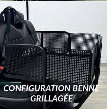
CONFIGURATION BENNE GRILLAGÉE