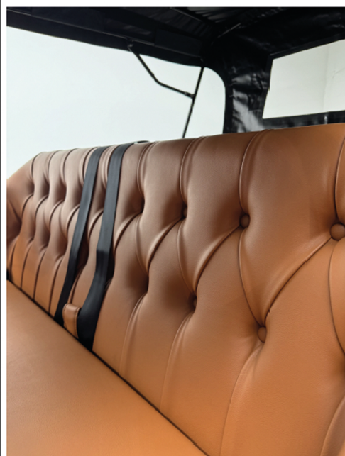
Sièges capitonnés en simili cuir et ceintures de sécurité