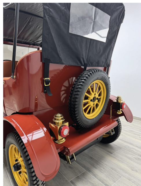
Look rétro de la Ford T