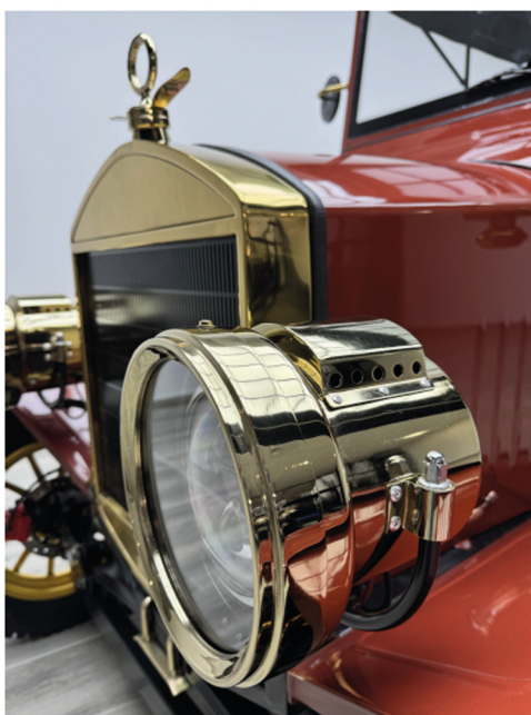
Calandre et phares style 1900